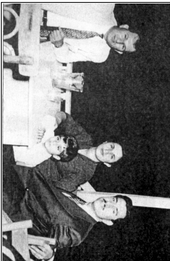
قه‌دری جان له‌گه‌ل دکتۆر عه‌بدو له‌رحمان قاسملو له شاری دیمه‌شق ئهم وینه‌یه له په‌رتوو که‌که‌ی دلاوه‌ری زه‌نگی (نقیسکاری کورد قه‌دری جان) وه‌رگیراوه.